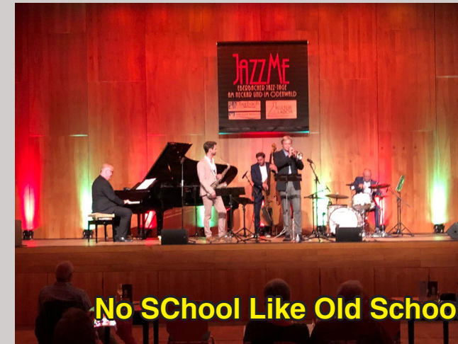
No School Like Old School